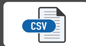
各種データはCSV形式でダウンロード可能