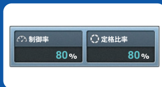
現在の制御率と定格比率を表示