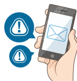
異常時はメールでお知らせ