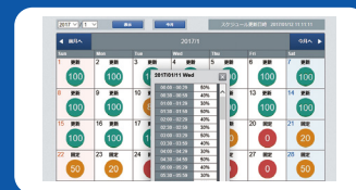
カレンダーで詳細な制御スケジュールを確認